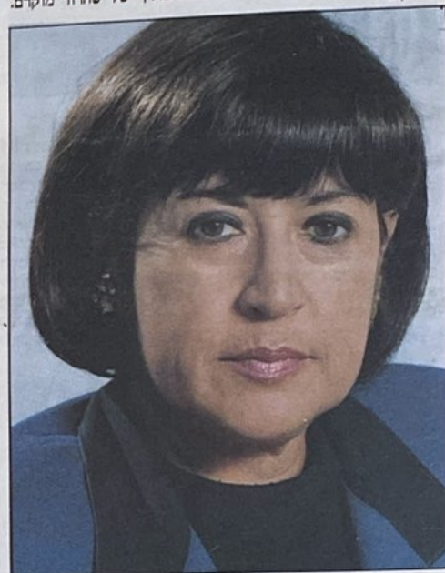
אל"מ דליה רוז (מיל.)

לאחרונה מתרכים הסימנים לכך ששלטונות הצבא רואים בחיילות נטל וכי הם פועלים בררכים שונות לצמצם עוד יותר את מקומן בצבא, להרחיק אותן מתפקידים "לא נשיים", לקצר את השרות שלהן ולהפעילן במסגרות מחוץ לתאל דרון החלטתו של תא"ל דרון אלמוג, שחיילות לא ישמשו יותר כמדריכות קליעה מוציאה מקשת העיסוקים של חיילות בצבא עוד עיסוק שאינו נכלל בטווח העיסוקים