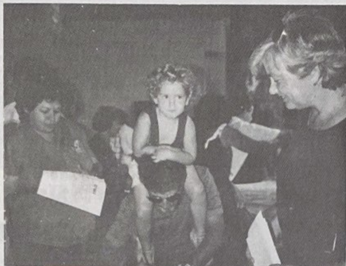
תנועת ש.י.ן מחתימה על עצומה נגד סגירת גני ילדים בימי שישי. ספט' 90

ההורים לתבוע את המגיע להם ולהבהיר לכל גורמי השלטון שלא ישלימו עם הגזילה ועם משטר האיור מים וההפחדות.