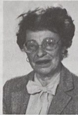
ח"כ שרה דורון

ח"כ שרה דורון: באשר לגליטימיות של הדיון אני סבורה שהתשובה היא בהחלט חיובית.